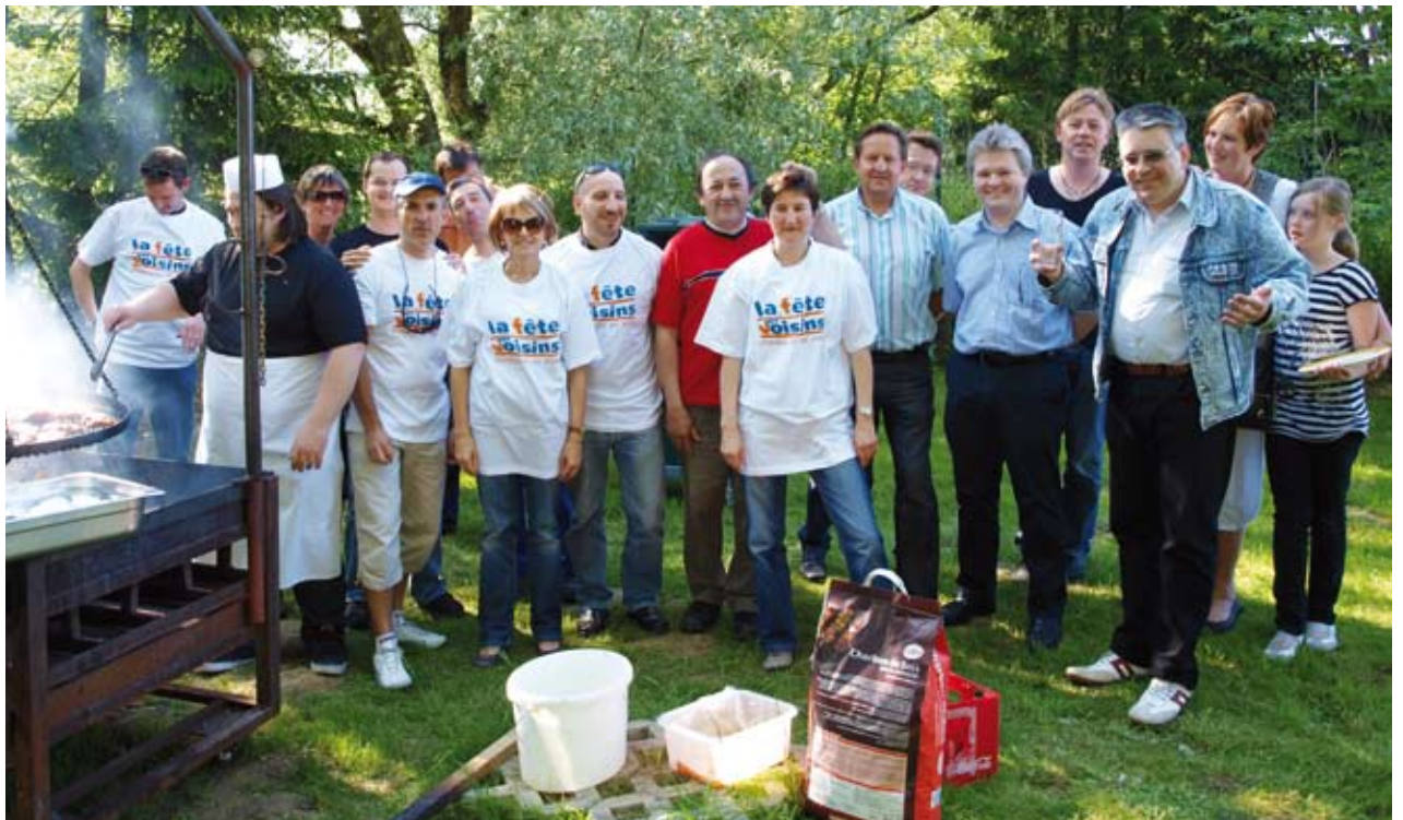
Nopeschfest organiséiert vum Eihlenger Konschtwierk