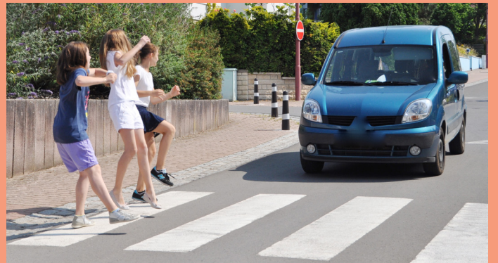
Autoen déi am Duerf rennen