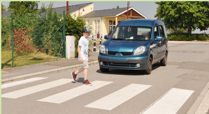
Autoen, déi eis laanscht loossen