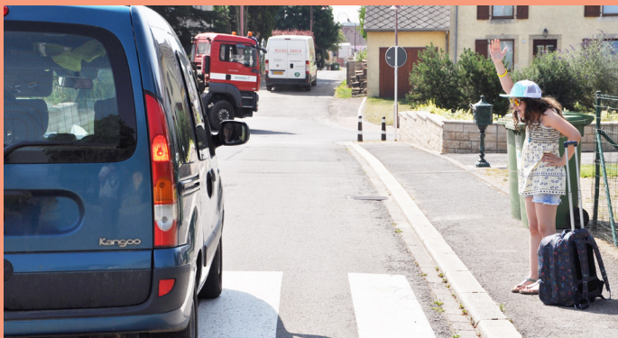
Autoen déi eis net laanscht loossen