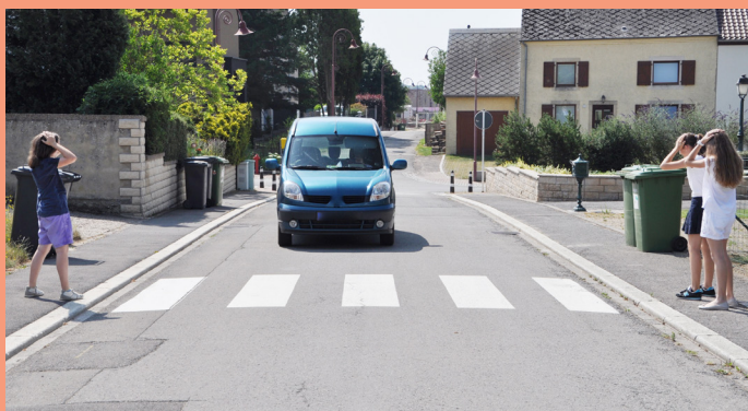
Autoen déi falsch fueren