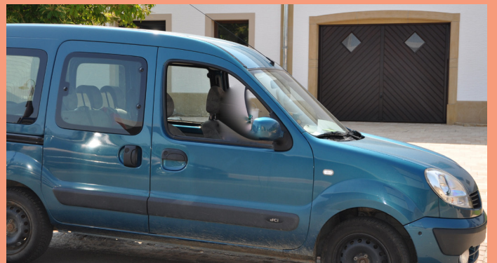
Autoen déi virun Afahrten parken