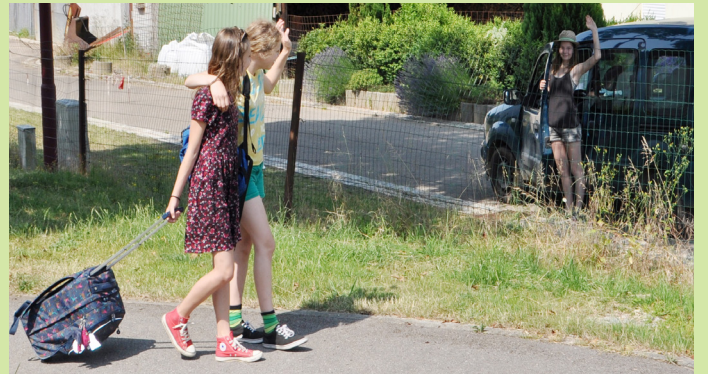
Zu Fouss an d'Schoul goën