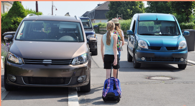
Autoen déi um Trottoir stinn