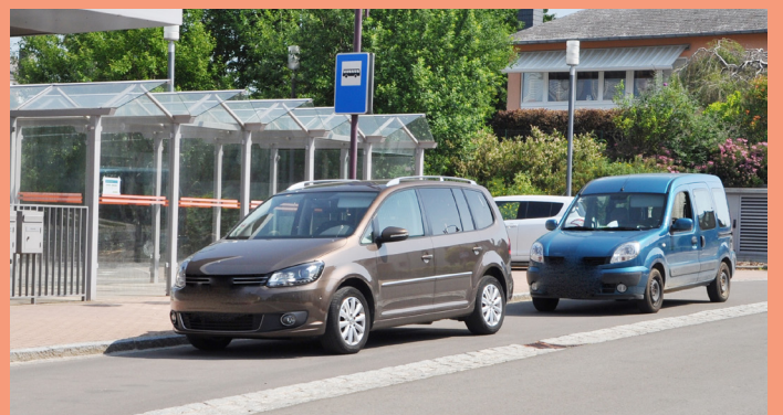
Autoen déi um Busarrêt parken